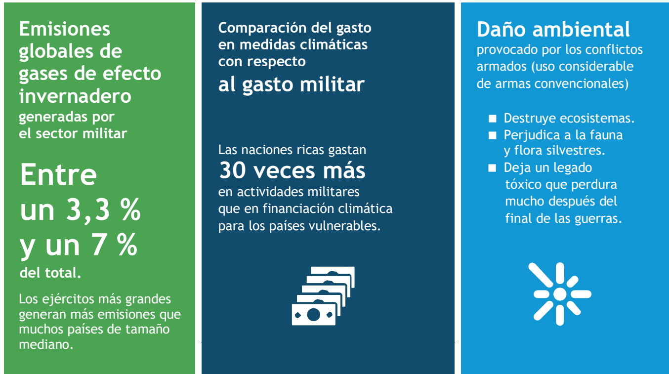
Figura 5: Gasto militar y su impacto en los objetivos climáticos

Fuente: Parkinson, S. et al. (2022): "Estimating the military's global greenhouse emissions". Conflict and Environment Observatory (CEOBS) ; Kotsis, K. T. (2024): "The impact of war on the environment". European Journal of Ecology, Biology and Agriculture 1 (5): págs. 89 a 100; Nakamitsu, I. (2020): "Foreword". En Rethinking Unconstrained Military Spending. Oficina de Asuntos de Desarme de las Naciones Unidas.