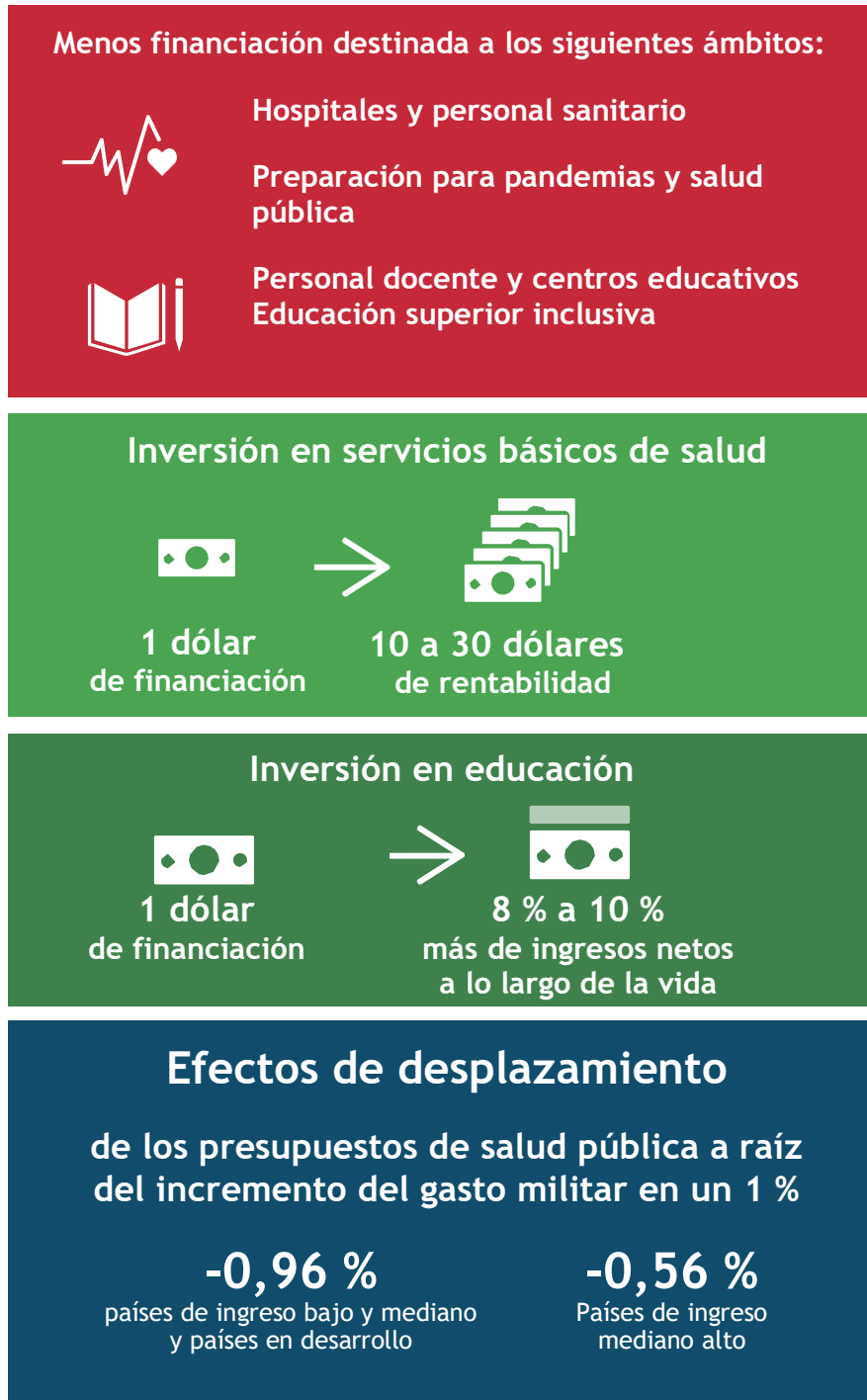
Figura 3: El peso del gasto militar sobre el desarrollo

Fuente: Cintron-Rodríguez, I. M. (s. f.): "The world at odds: Military spending vs. SDG achievement"; Fan, H. et al. (2018): "Do military expenditures crowd-out health expenditures? Evidence from around the world, 2000-2013". Defence and Peace Economics 29 (7): págs. 766 a 779.