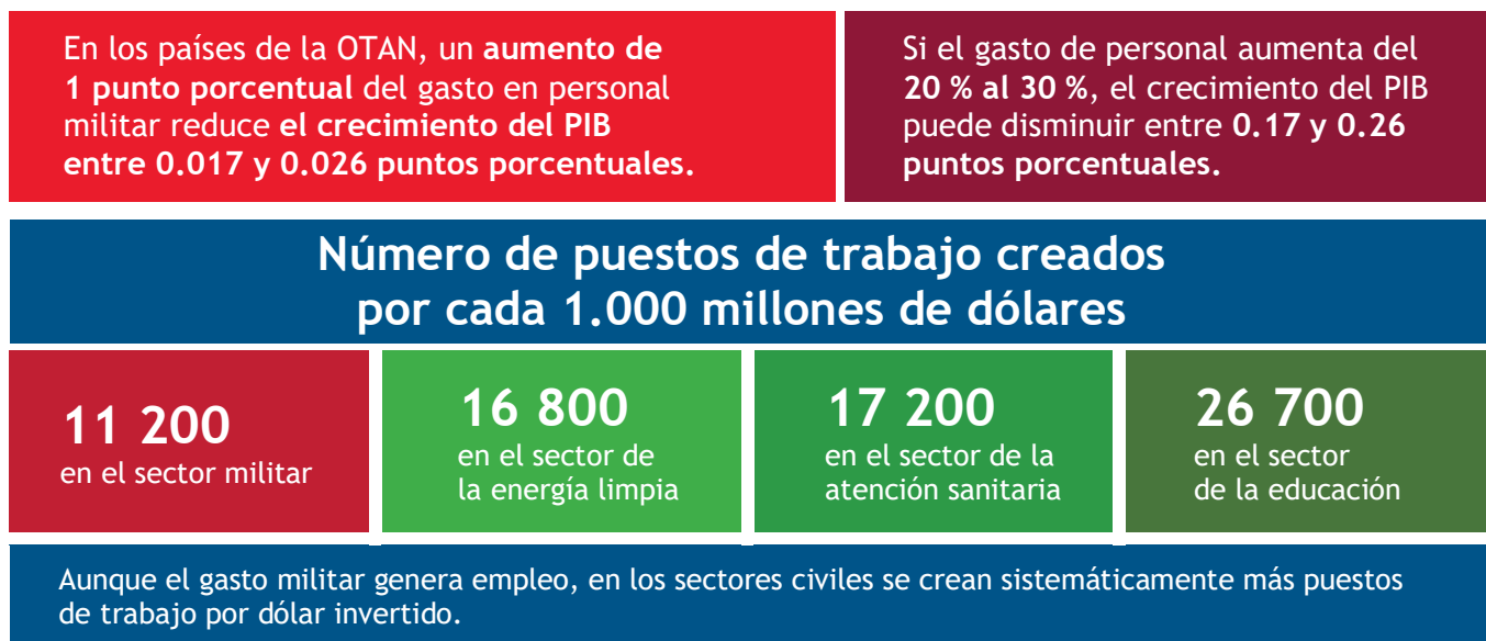
Figura 4: Gasto militar y su repercusión en la economía

Fuente: Stuckler, D., Reeves, A. y Mckee, M. (2017): "Social and economic multipliers: What they are and why they are important for health policy in Europe". Scandinavian Journal of Public Health 45 (18): págs. 17 a 21; Sheremirov, V. y Spirovska, S. (2022): "Fiscal multipliers in advanced and developing countries: Evidence from military spending." Journal of Public Economics 208: 104631; Becker, J. y Dunne, J. P. (2023): "Military spending composition and economic growth". Defence and Peace Economics 34 (3): págs. 259 a 271.